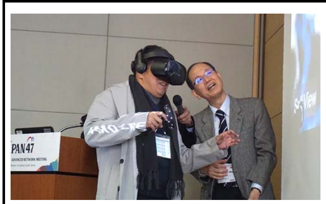
撮影場所：九州大学病院