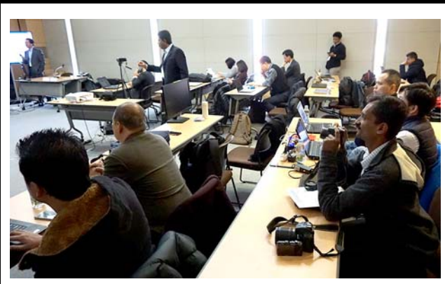
本会場にて、VRを体験する参加者。