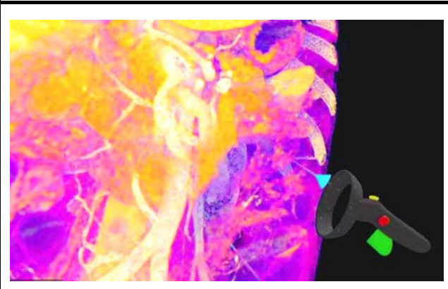
VRのデモンストレーション。