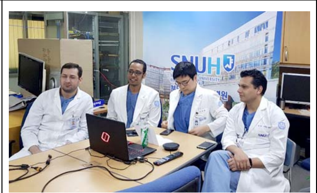
ソウル大学ブندگان病院の様子。 撮影場所：ソウル大学ブندگان病院