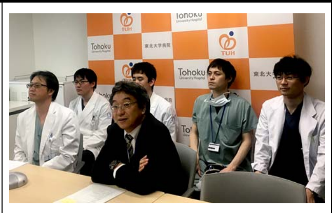
東北大学の様子。 撮影場所：東北大学