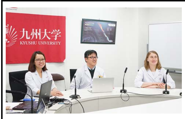
九州大学病院の様子。 撮影場所：九州大学病院