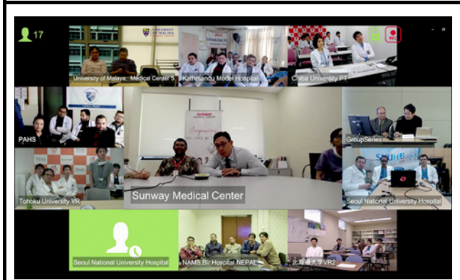
モニターに表示される接続施設。 撮影場所：九州大学病院