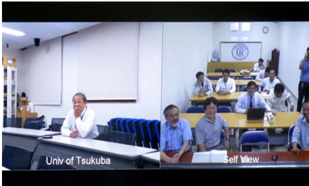
モニタに映し出される接続施設。