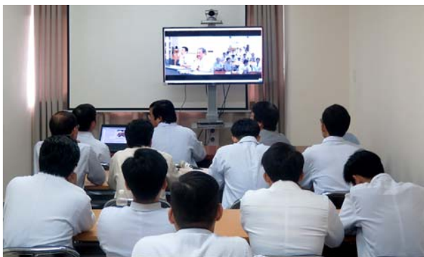
チョーライ病院の様子。