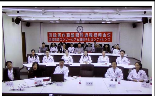
大連医科大学の様子。 撮影場所：大連医科大学