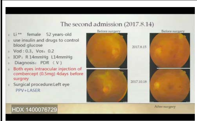
表示されたスライド。 撮影場所：九州大学病院