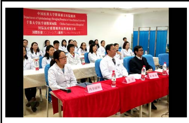
中国医科大学の様子。 撮影場所：中国医科大学