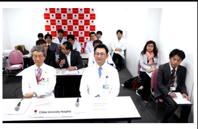
千葉大学の様子。 撮影場所：千葉大学