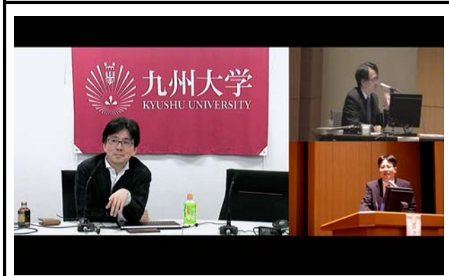
モニターに表示される接続施設。