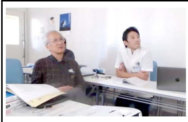
鹿児島大学の様子。