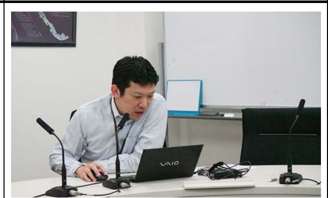
九州大学病院の様子。