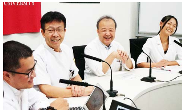
カンファレンスは和やかに進んだ。