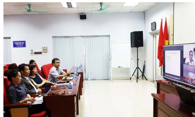
ハノイ医科大学での様子。