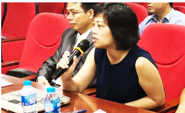
ハノイ医科大学から質問する歯科医師（右）。