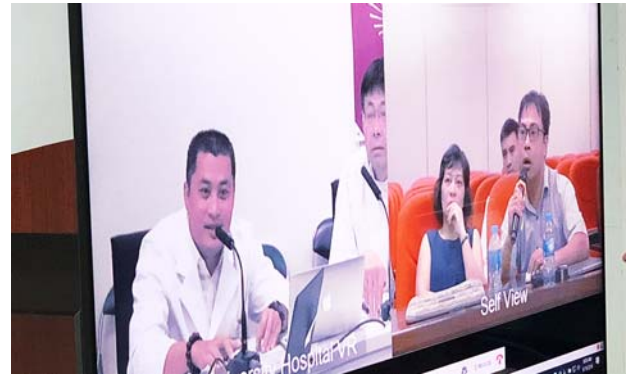
2施設で質疑応答をする様子。