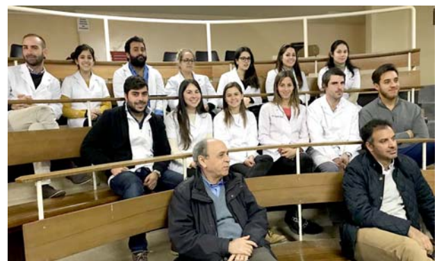
ウルグアイ共和国大学の様子。