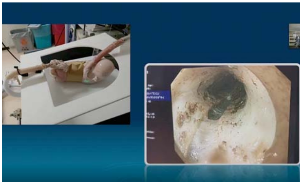
提示されたスライド。