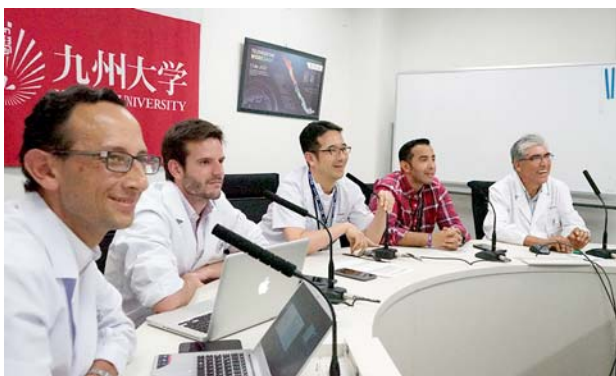
九州大学病院の様子。