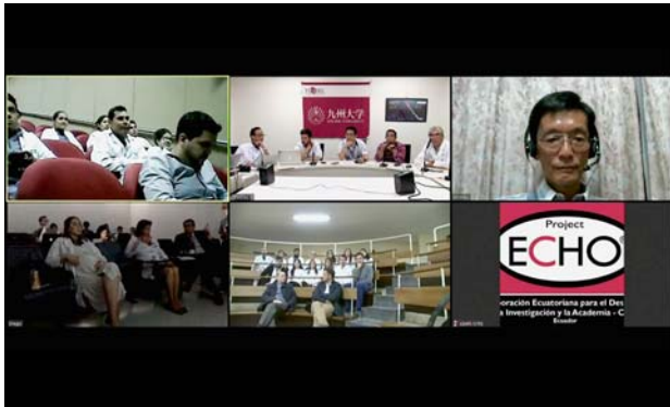
モニターに表示される接続。