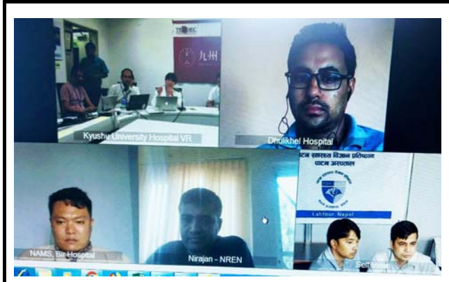
モニターに映し出される接続施設。 撮影場所：パタン健康科学専門学校