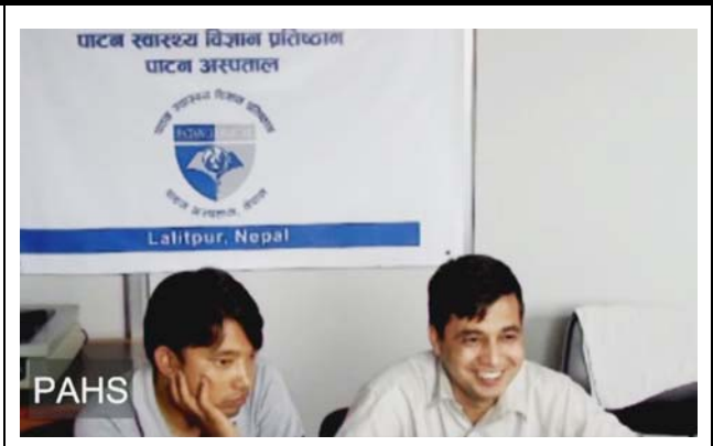
パタン健康科学専門学校の様子。 撮影場所：九州大学病院