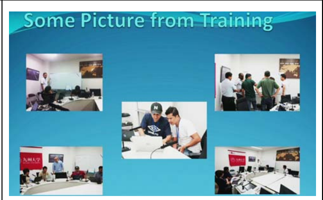
提示されたスライド。 撮影場所：九州大学病院