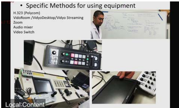
ハノイ医科大学の様子。 撮影場所：九州大学病院