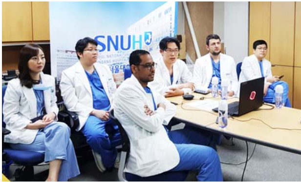
ソウル大学ブンダン病院の様子。