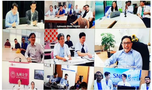
モニターに映し出される接続施設。