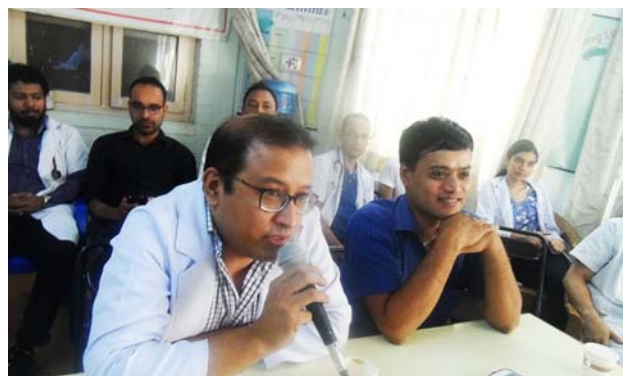
カトマンズモデル病院からコメントする医師 (左)。