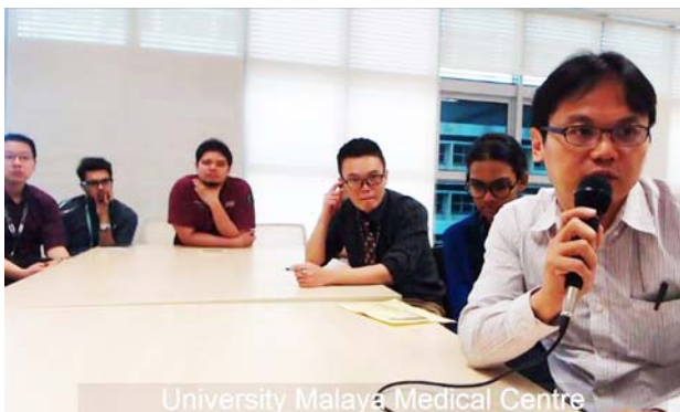
マラヤ大学からコメントする医師 (右)。