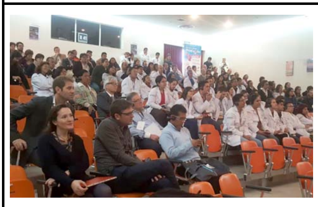
撮影場所：九州大学病院