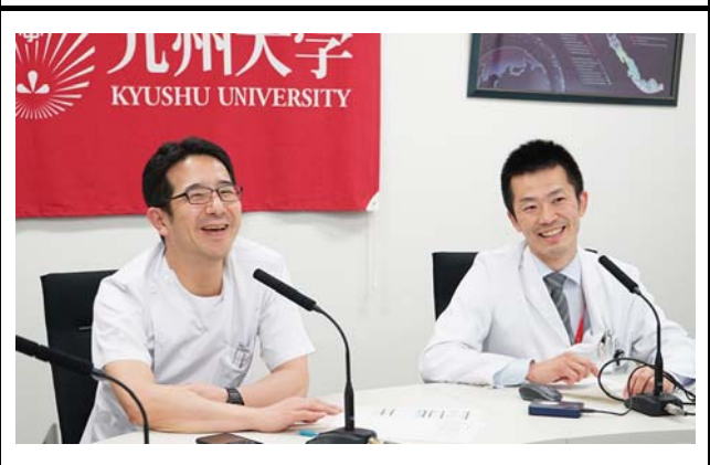
ボリビア・日本消化器センターの様子。