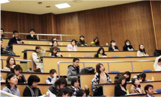
九州大学病院の会場の様子。