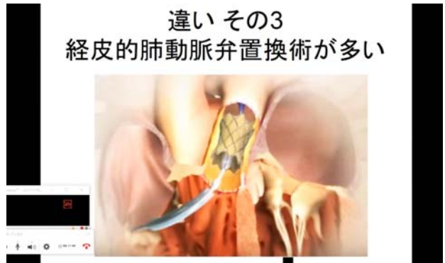
提示されたスライド。