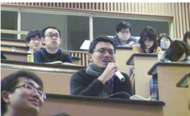
九州大学病院から質問する参加者(中央)。