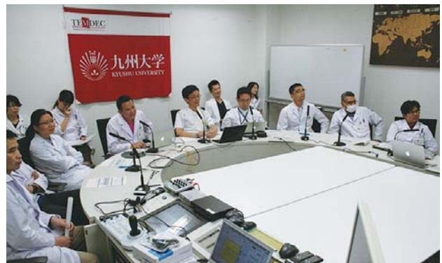
モニタに映し出される接続施設。 撮影場所：九州大学病院