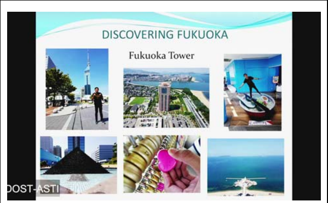
提示されたスライド。