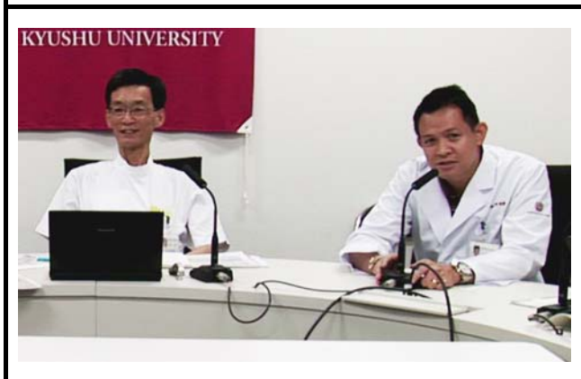
撮影場所：九州大学病院