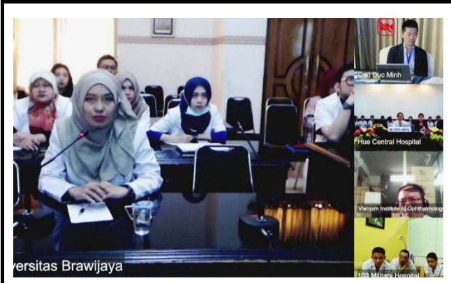
ブラウィジャヤ大学から発表する医師（左）。 撮影場所：九州大学病院