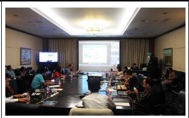
大連国際金融会議センターの会場の様子。 撮影場所：大連国際金融会議センター