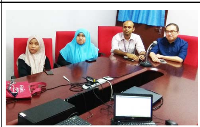
マレーシアサインズ大学での会場の様子。 撮影場所：マレーシアサインズ大学