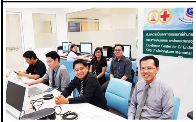
チュラロンコン大学の会場の様子。 撮影場所：チュラロンコン大学