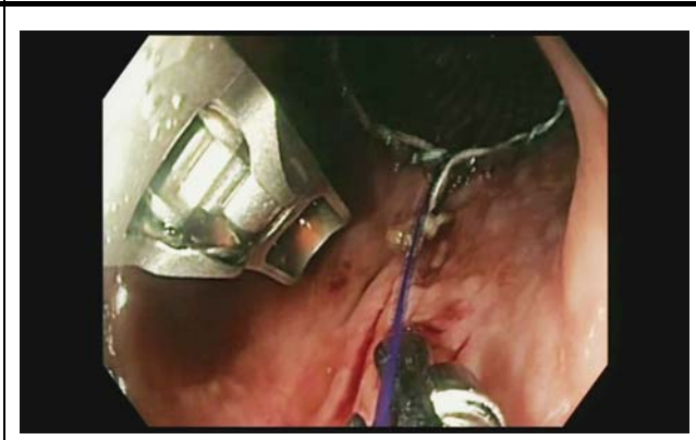
提示された内視鏡動画。 撮影場所：九州大学病院