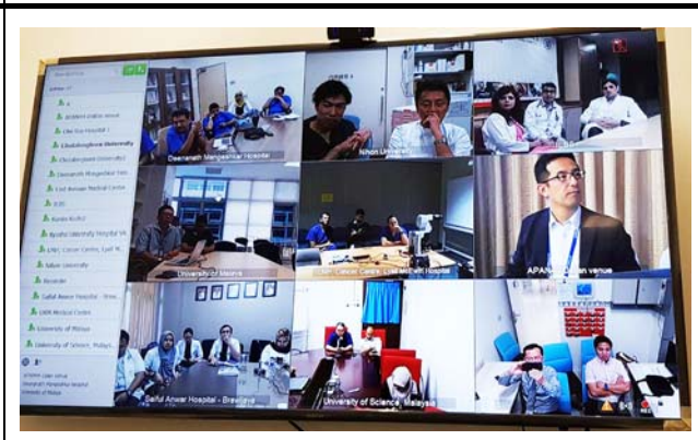
モニタに映し出される接続施設。 撮影場所：チュラロンコン大学