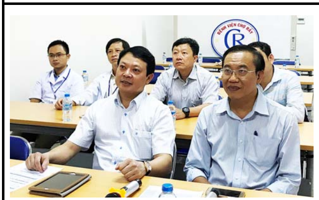
チョーライ病院の会場の様子。 撮影場所：チョーライ病院