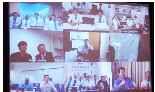
スクリーンに映る接続施設。