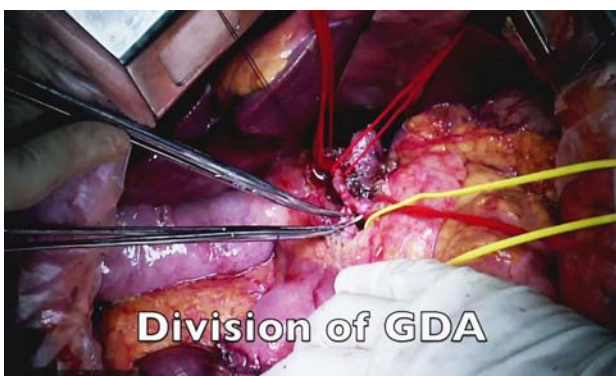
提示された手術動画。