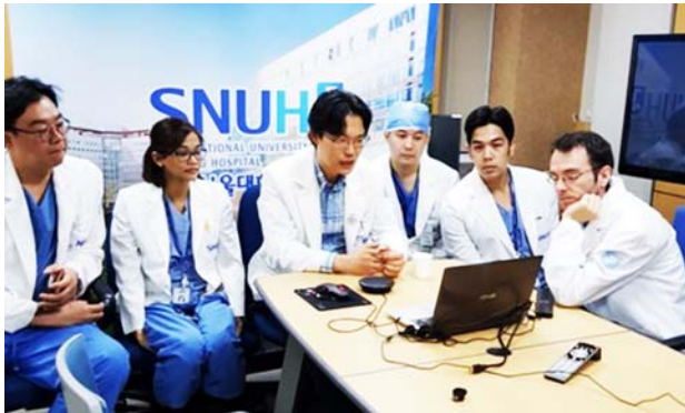
ソウル大学ブندان病院の会場の様子。