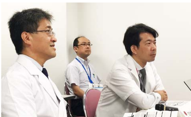
千葉大学の会場の様子。