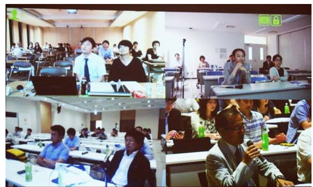
会場で質問をする医師（左）。 撮影場所：レソラ天神