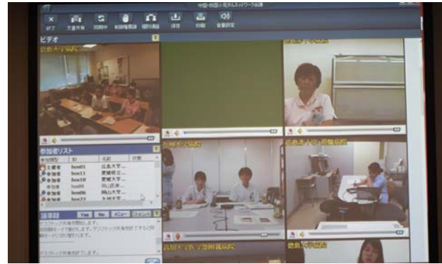
愛媛大学での会場の様子。 撮影場所：九州大学病院