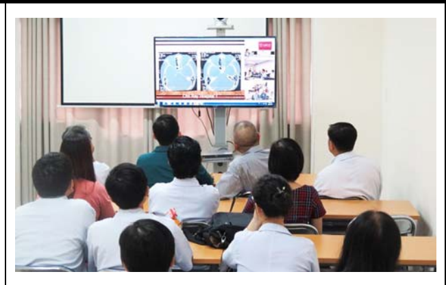
チョーライ病院でモニターを見つめる参加者。 撮影場所：チョーライ病院