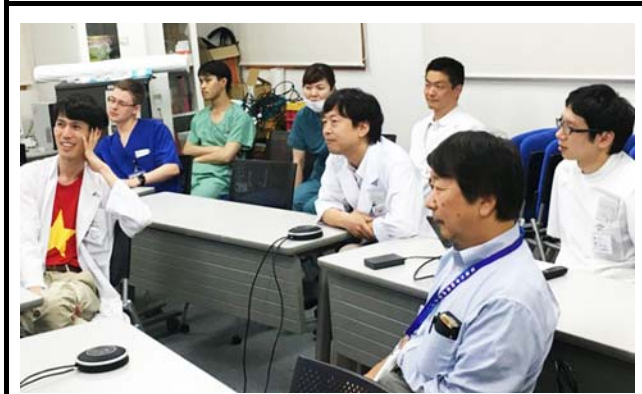
筑波大学での会場の様子。 撮影場所：筑波大学