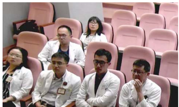
台北榮民総医院の様子。