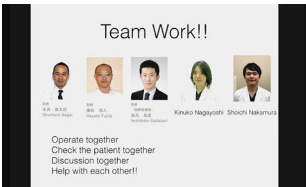
提示されたスライド。