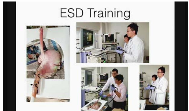
提示されたスライド。