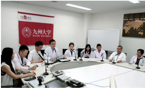
九州大学病院の様子。