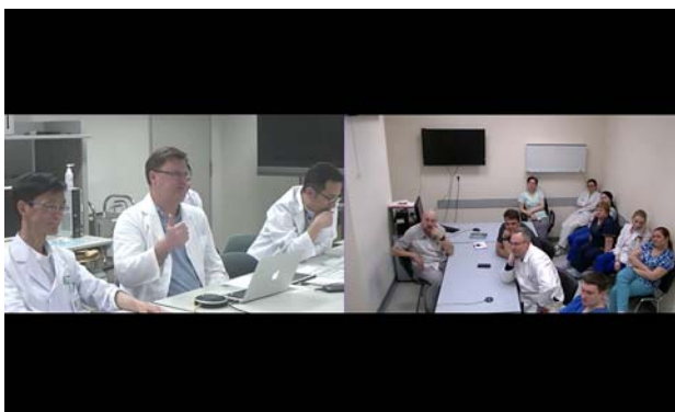
モニタに表示される接続施設。