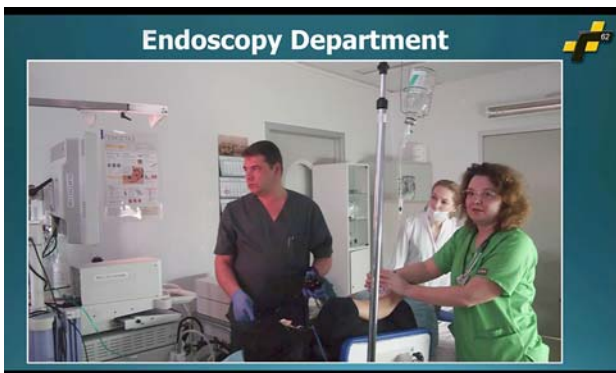
提示されたスライド。