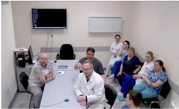
モスクワ市第62がん病院の様子。