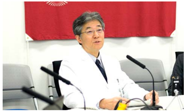
九州大学病院の様子。