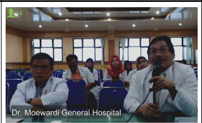
セベラス・マレット大学 ムワルディ病院での会場の様子。 撮影場所：九州大学病院