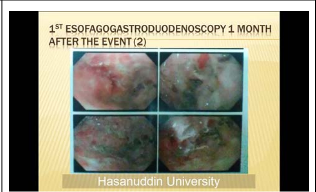
提示されたスライド。 撮影場所：九州大学病院