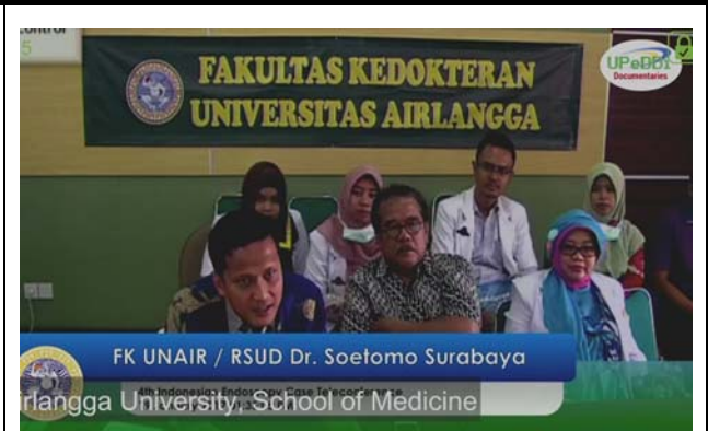
アイルランガ大学での会場の様子。 撮影場所：九州大学病院