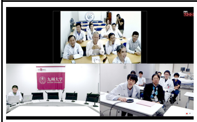
モニタに表示される接続地点。