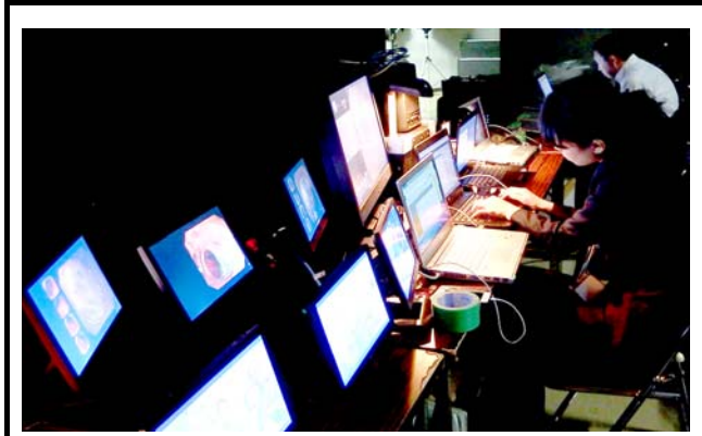
舞台裏で接続を調整する九州大学のエンジニア。