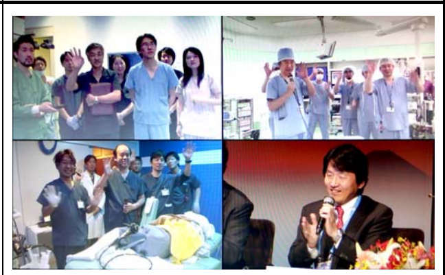
モニタに映し出された4地点の様子。