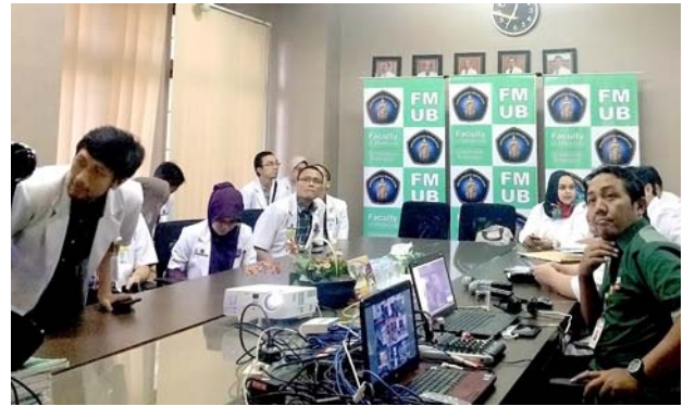
ブラウィジャヤ大学の様子。