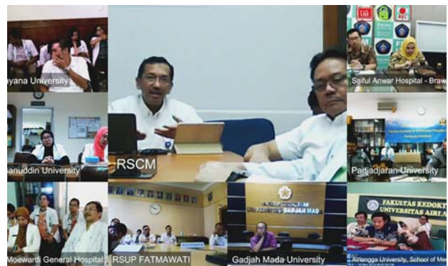
モニターに表示される接続施設。