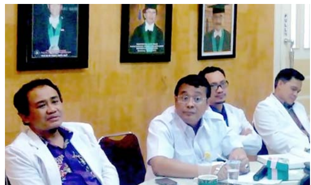
ディポネゴロ大学の様子。