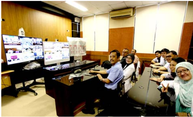
ガジャ・マダ大学の様子。