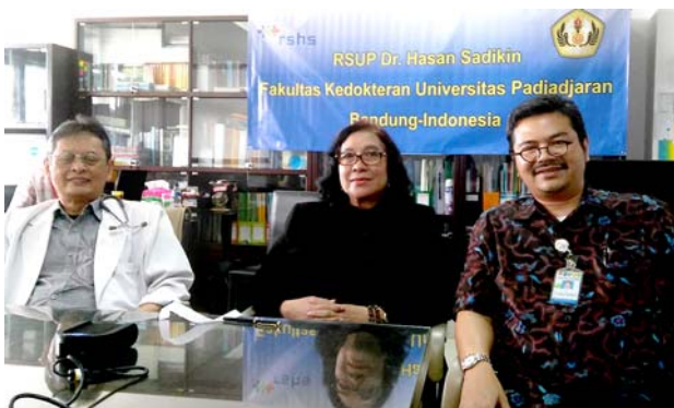
パジャジャラン大学の様子。