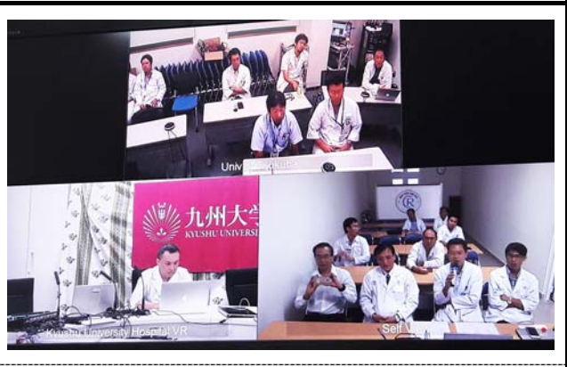
モニターに映し出される 3 施設。 撮影場所：チョーライ病院