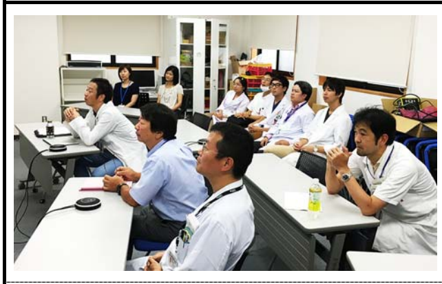
筑波大学での会場の様子。 撮影場所：筑波大学