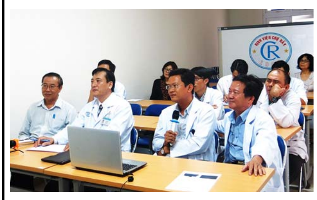
チョーライ病院での会場の様子。 撮影場所：チョーライ病院