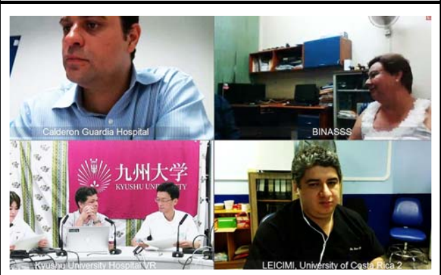
モニターに映し出される4地点。