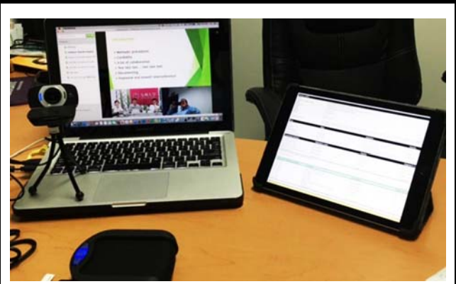
コスタリカ ガストロクリニカで使用した機材。