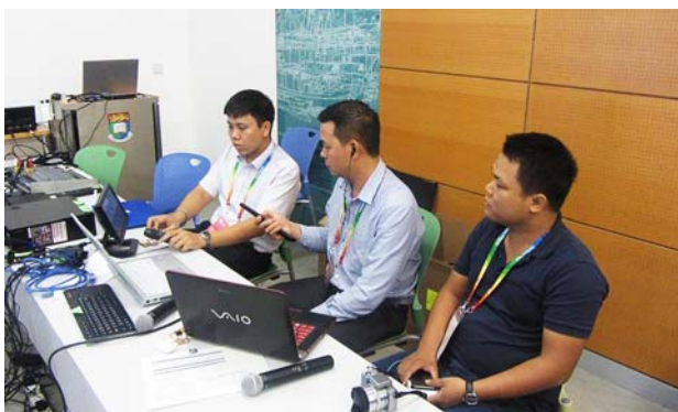
香港大学の会場の様子。 撮影場所：香港大学