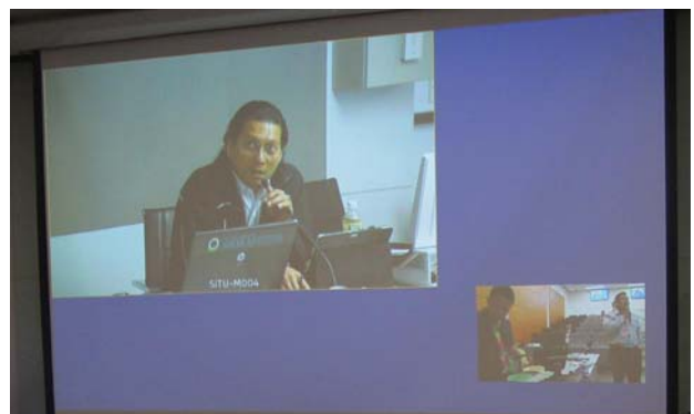
メイン会場でサポートするエンジニア。 撮影場所：香港大学