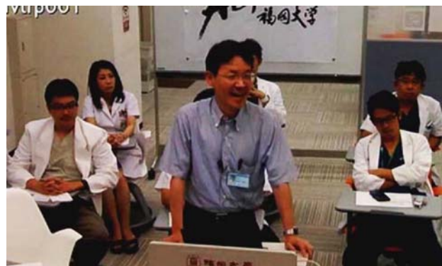
香港大学でのメイン会場の様子。