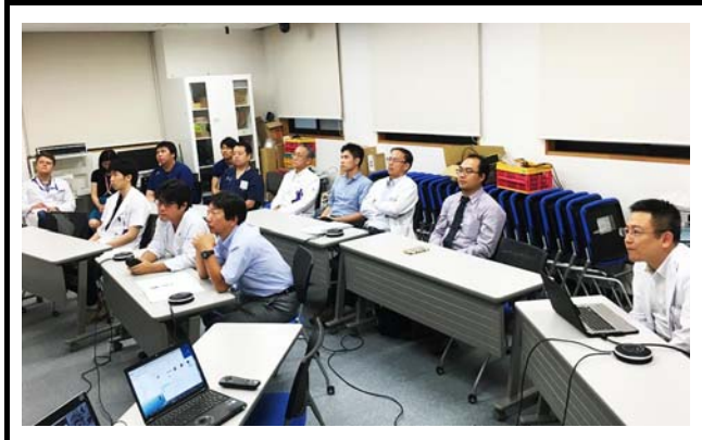
筑波大学での会場の様子。