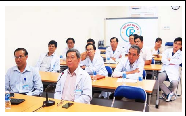
チョーライ病院での会場の様子。