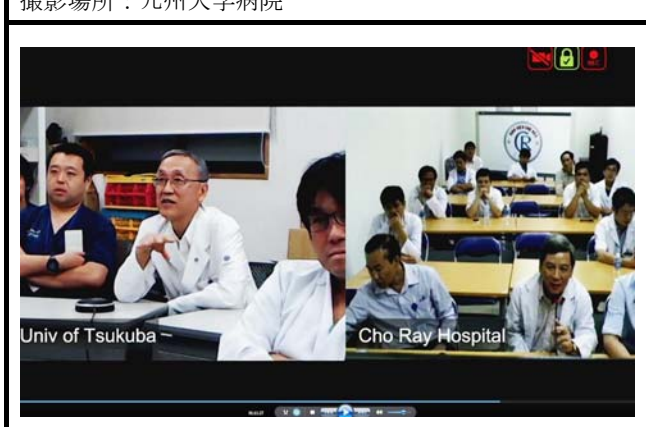
モニタに映し出される筑波大学(左)とチョーライ病院(右)。