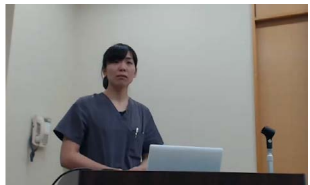
提示されたスライド。 撮影場所：九州大学病院