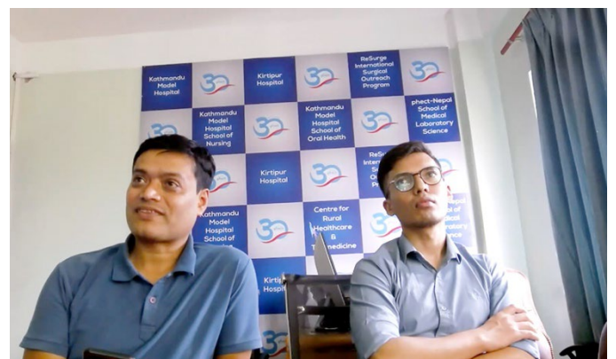
カトマンズモデル病院の様子