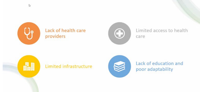
提示されたスライド