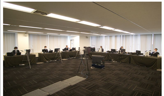
メイン会場の様子。