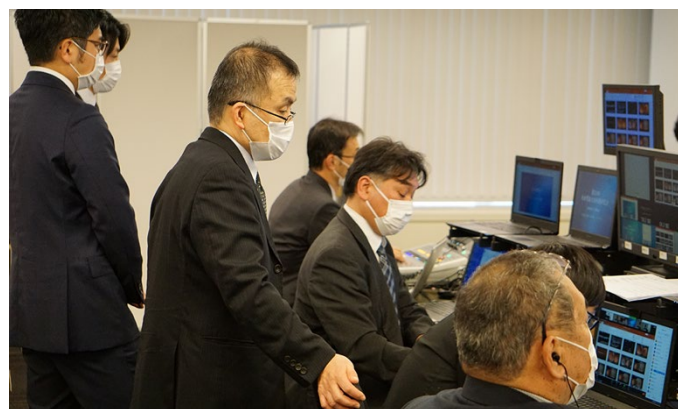
接続を調整するエンジニア。