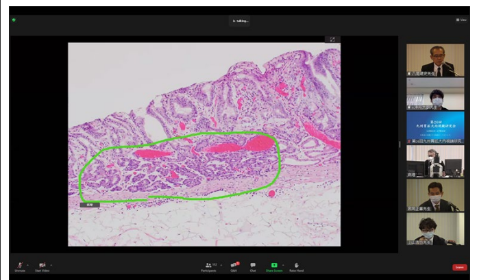
提示されたスライドとアノテーション機能。