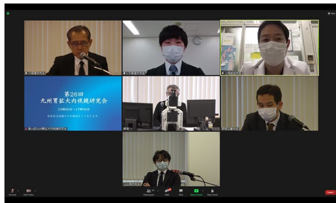
モニタに映し出される接続施設。

第26回九州胃拡大内視鏡研究会をウェブ開催した。プレゼンテーションも問題無く行われ、内視鏡画像や病理組織学的所見を呈示し、活発にディスカッションもウェブ上で行われた。181名が参加した。