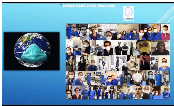
提示されたスライド。