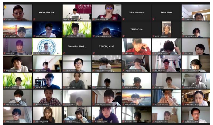
多くの学生がオンラインで参加している様子。