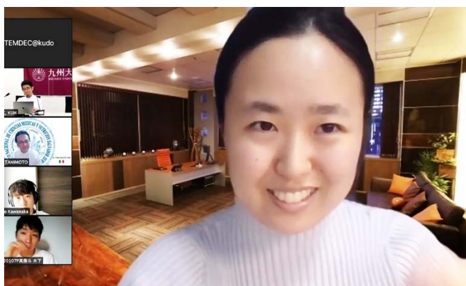
英語で質問する学生。