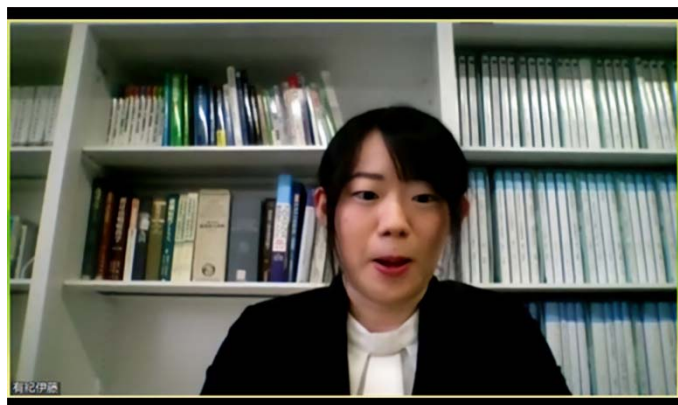
産業医科大学から発表する医師。