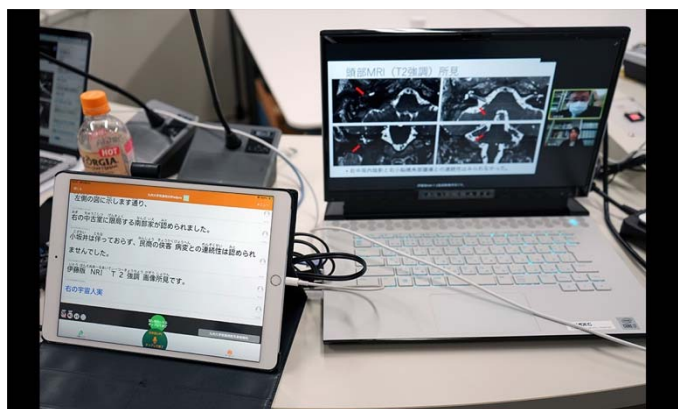
情報バリアフリーのための字幕機能の導入。

日本耳鼻咽喉科学会福岡県地方部会をZOOMウェビナーとして開催した。あらかじめ提供された音声入り発表動画をTEMDECのスタジオから放送した。福岡県内6ヶ所の中継会場を繋ぎ質疑応答に対応した。中継会場以外からは個人の端末で視聴した。難聴者への情報保障用に字幕機能を構築した。オンライン参加の手軽さも手伝い、例年を大きく上回る約270名の参加者が視聴した。