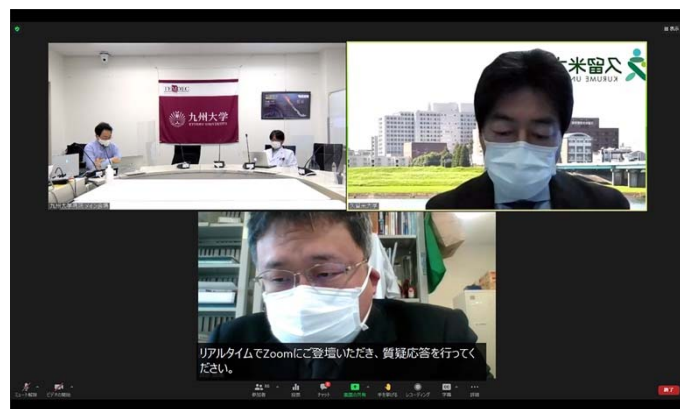
モニタに映し出される接続施設。