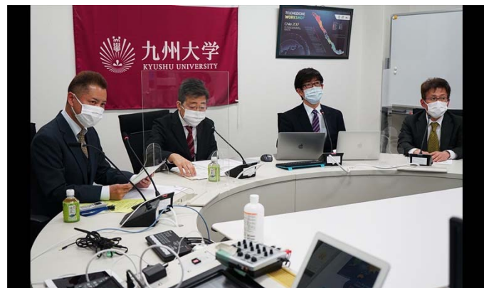
引き続き行われた会議。