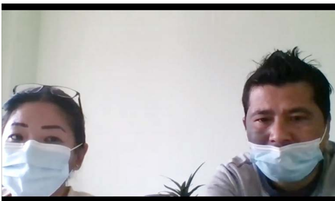
カトマンズモデル病院の様子。