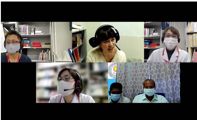
モニタに表示される接続施設。

2日間にわたり、TEMDECが開発した遠隔会議マネジメントシステムのmed-hokの使用方法についてオンライン研修を実施した。第51回APAN会議（2021年2月開催）では4施設が初めてmed-hokを利用した一方、操作方法の理解が不十分だったためシステムを使わなかったセッションがあった。今回は画面を共有して実際に操作しながら説明を行うことで参加者の理解を深めることができた。とても有意義な研修であったと考える。