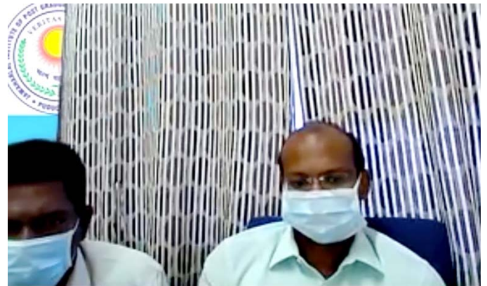
ジャワハルラール 医学教育研究大学院の様子。