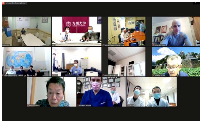
モニタに表示される接続施設。

第11回ロシアとの内視鏡テレカンファレンスでは早期食道がんに焦点を当てた。食道がんは最も進展の速い癌の一つといえる。興味深い異なる種類の早期食道腫瘍である食道腺がんと食道扁平上皮がんの2症例が提示され、参加者、病理専門医と内視鏡専門医が内視鏡所見と組織所見について議論を行った。