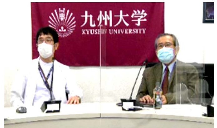
九州大学病院の様子。