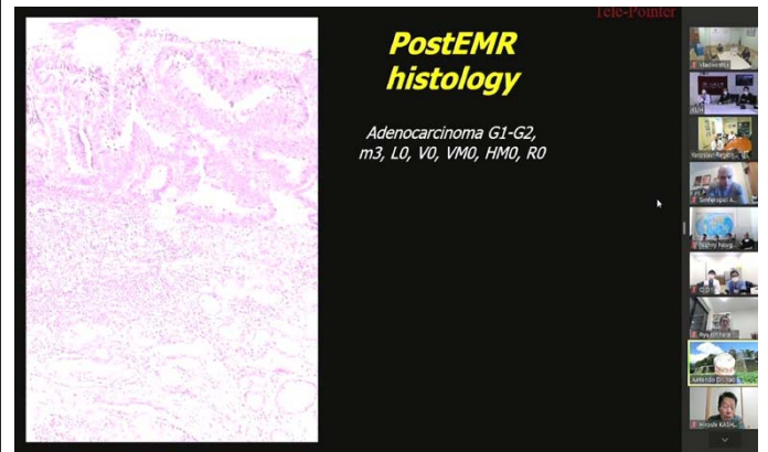
提示されたスライド。