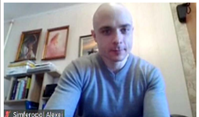
シンフェロポリ内視鏡センターの様子。