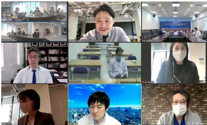
モニタに表示される接続施設。

アジア健康構想（AHWIN）協力覚書に基づき、インドネシア、ベトナム、フィリピン、インドの各国と、デジタル技術を活用した遠隔医療技術に関するオンライン国際カンファレンスが内閣官房により企画された。日本企業が各国の医師達に対して自社製品をユースケースとして紹介し、今回はベトナムの主要大学や基幹病院との間で活発な意見交換が行われた。