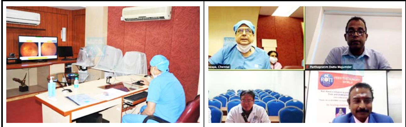
サンカーラ・ネスララヤ病院の様子。 モニタに映し出される接続施設。 撮影場所：サンカーラ・ネスララヤ病院 撮影場所：サンカーラ・ネスララヤ病院