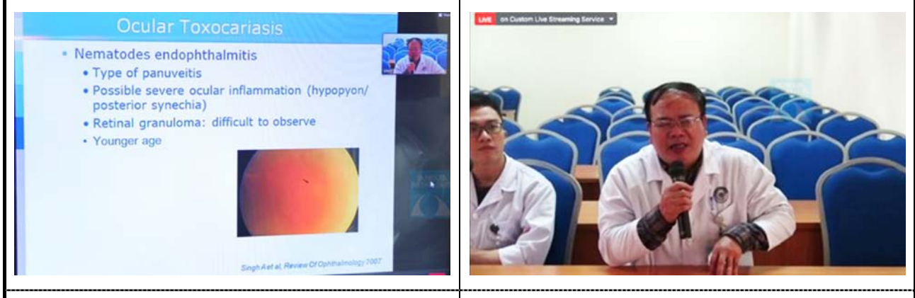
提示されたスライド。 ベトナム国立眼科研究所からコメントする医師。 撮影場所：サンカーラ・ネスララヤ病院 撮影場所：サンカーラ・ネスララヤ病院