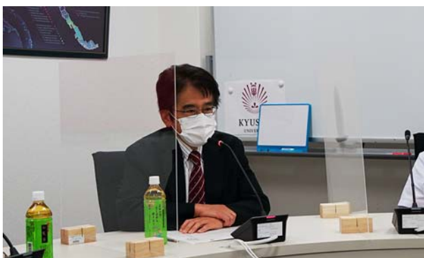
撮影場所：九州大学病院