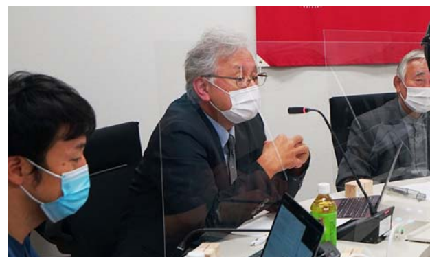
九州大学病院グローバル感染症センター長からコメント。