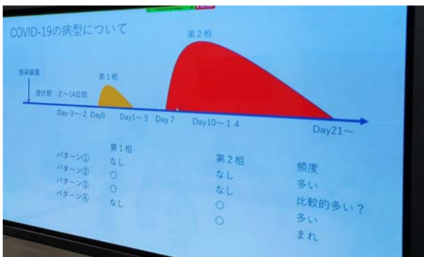
撮影場所：九州大学病院