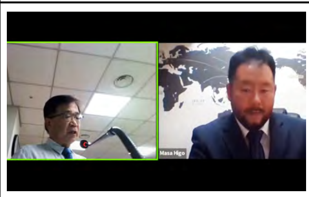
モニタに映し出される老年医学チーム。