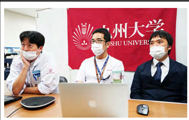
九州大学病院消化器内科チームの様子。