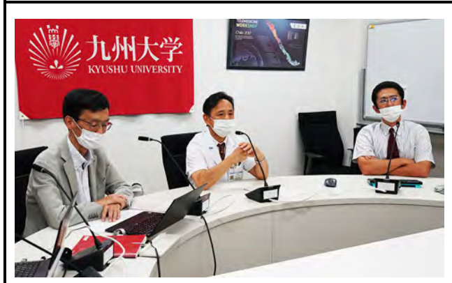
九州大学病院肝胆膵外科チームの様子。