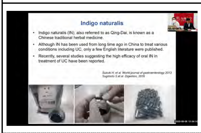
提示されたスライド。