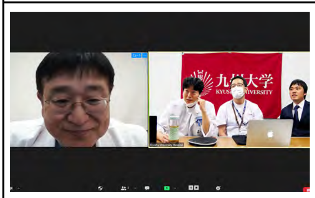
モニタに映し出される接続施設。