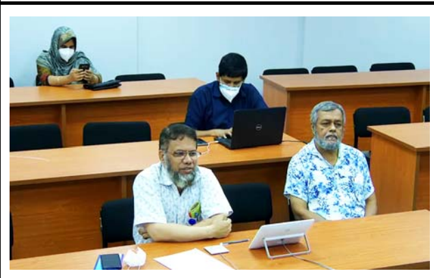
ランブル医科大学・病院の様子。