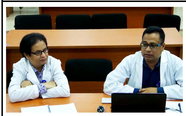
マイメンシン医科大学の様子。