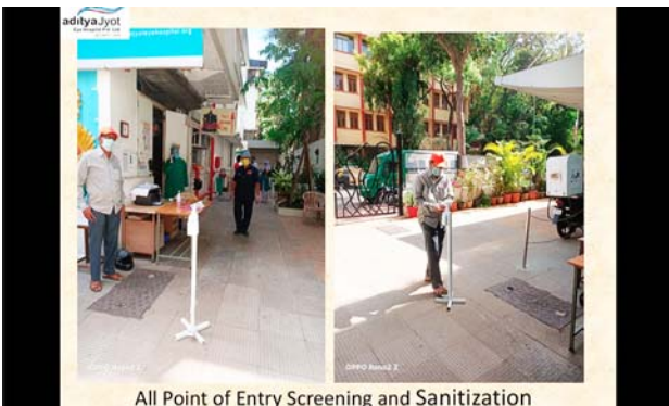
提示されたスライド。