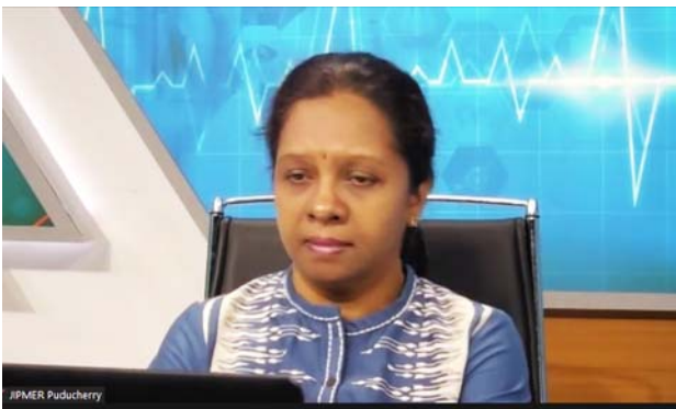
ジャワハルラール 医学教育研究大学院の様子。