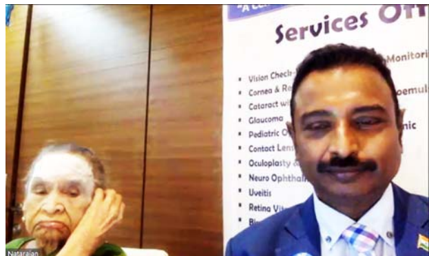
アディティア・ジヨット眼科病院の様子。