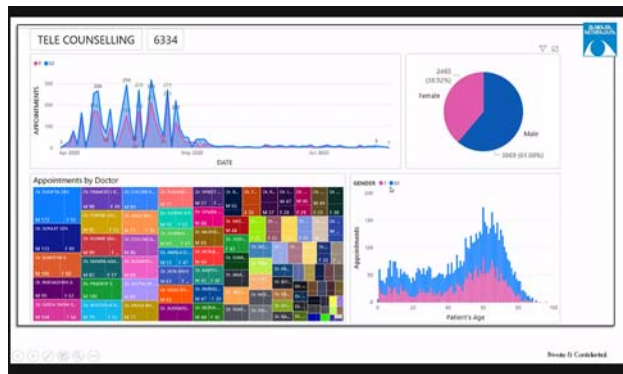
提示されたスライド。