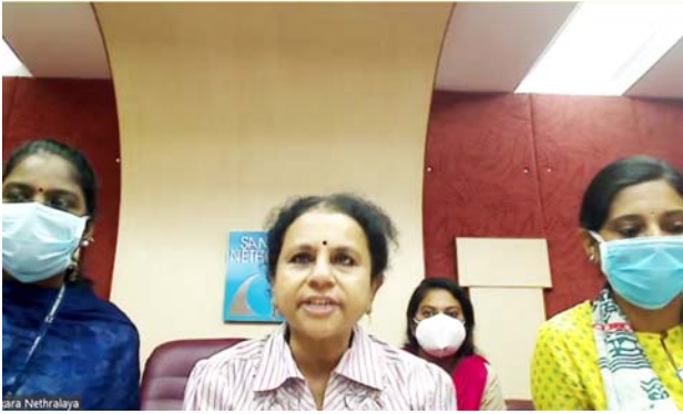
サンカーラ・ネスララヤ病院の様子。

【概要】 今回のオンライン会議はとても良かった。ネットワーク接続に問題はなく、セッション全体を通して音や画像が途切れることも無かった。発表者は会議に参加することができて非常に満足していた。接続施設の参加者は、眼に関するCOVID-19の感染の様々な側面について知識を得ることができた。