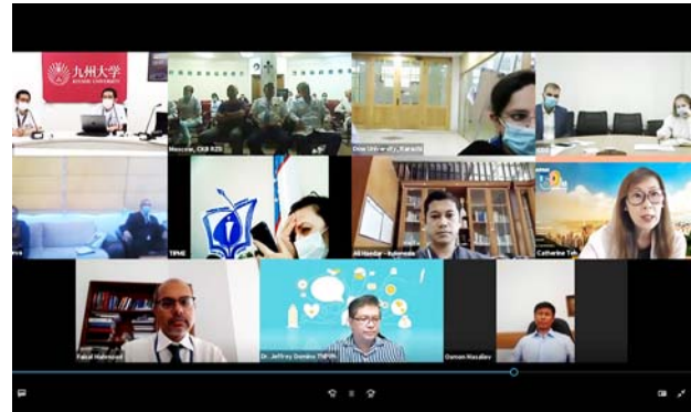
ロシア鉄道 リュブリノ駅ニコライ・セマシコ病院の様子。 撮影場所：九州大学病院