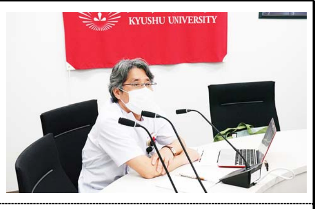
九州大学病院から参加する医師。 撮影場所：九州大学病院