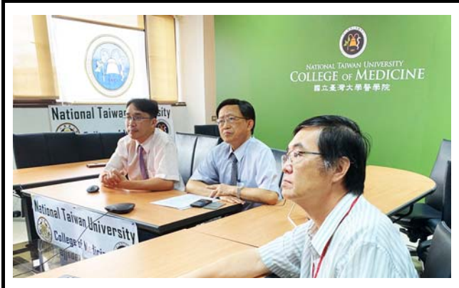
国立台湾大学の様子。 撮影場所：国立台湾大学

【概要】 今回、アジア太平洋循環器学会 (APSC) がAPAN医療ワーキンググループの活動に初めて関わった。この会議はCOVID-19が世界的に流行する中で、医療知識をやり取りするのにとても良い選択肢であると感じた。音質・映像の質ともに、互いに学ぶのに十分な情報を提供した。オンラインでの会議は教育のために非常に有効な方法であり、将来さらなるイベントが開催されることを願う。