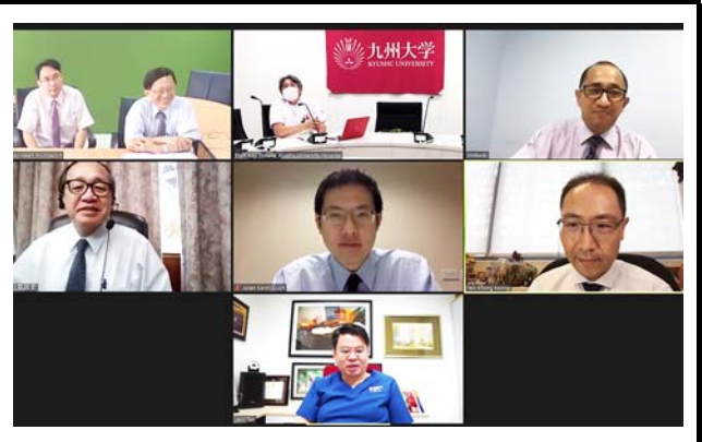
モニタに映し出される接続施設。 撮影場所：九州大学病院