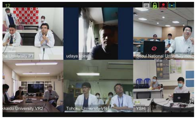
ソウル大学ブندگان病院の様子。