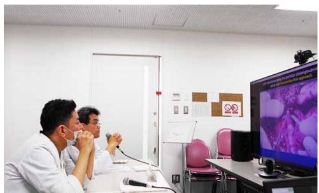
ヤンゴン専門病院の様子。