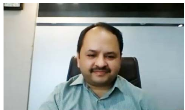
コメントする医師。