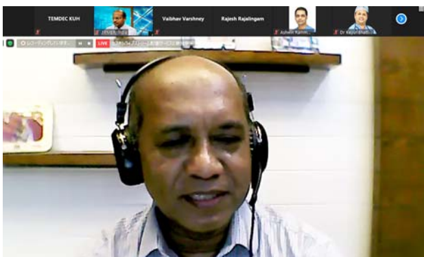
撮影場所：九州大学病院