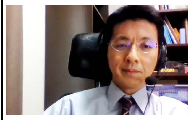
提示されたスライド。 撮影場所：九州大学病院